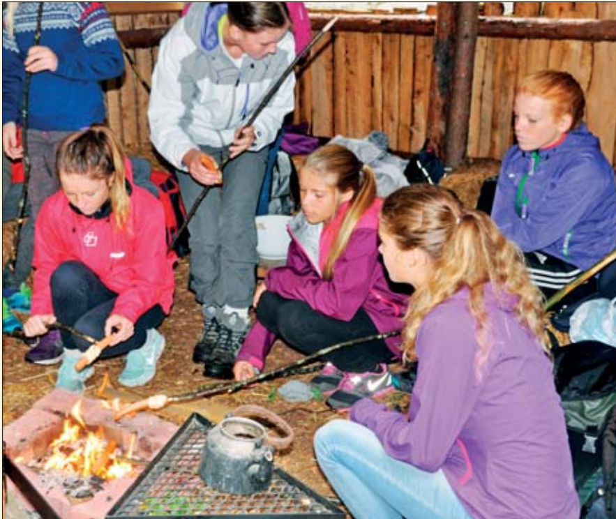
Mat er viktig. Våre pilegrimer ble møtte i gapahuken på Gunheim av bål, pølser og pinnebrød.