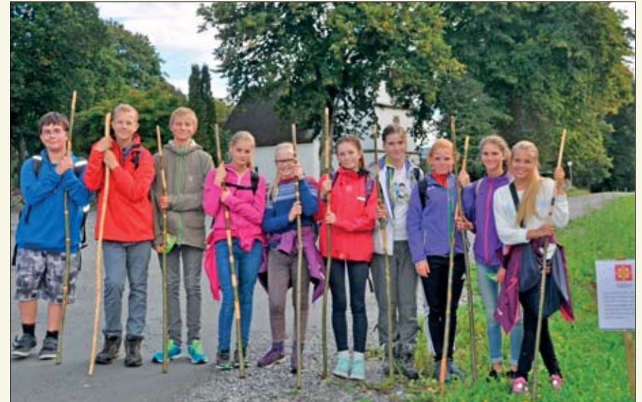
En pilegrim er en person på vei mot et hellig mål. For denne gruppa pilegrimer var Nes kyrkje målet.