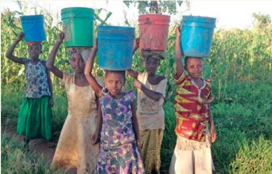
Jentene i Tanzania må gå mange kilometer for å hente vann til familien.