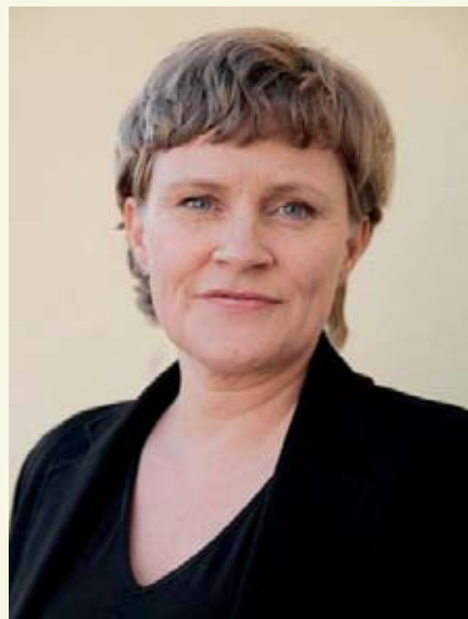
Anne-Marie Helland, generalsekretær i Kirkens nødhjelp.