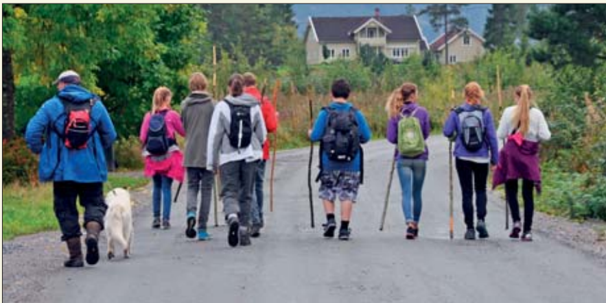
En pilegrim berører jorden med en fot av gangen.