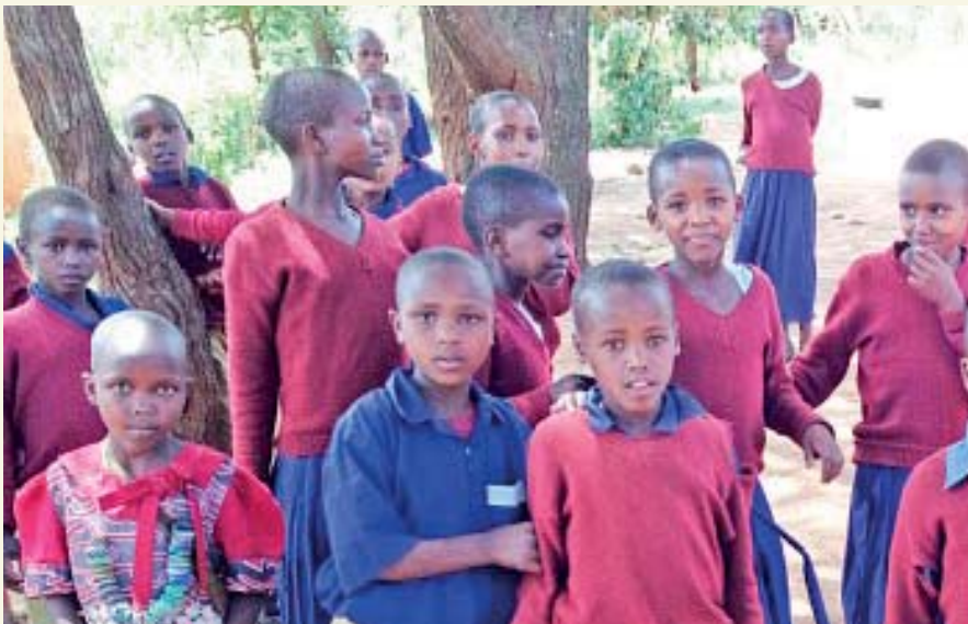
Mange jenter går glipp av verdifull skolegang fordi de må hente vann til familien.